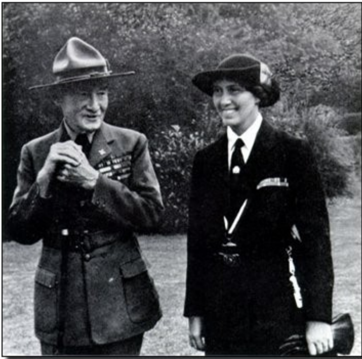
The Chief Scout and the Chief Guide, B-P and Olave, 1929